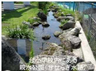
台小学校内にある親水公園(せせらぎ水路)

平成10年より45haの県営ほ場整備事業を行い用水路のパイプライン化を図ると同時に近接する台小学校に「親水公園」を造設した。