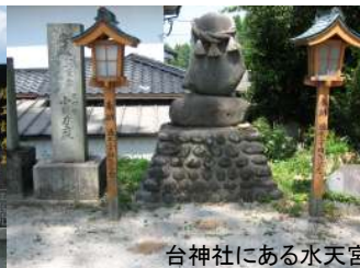
台神社にある水天宮