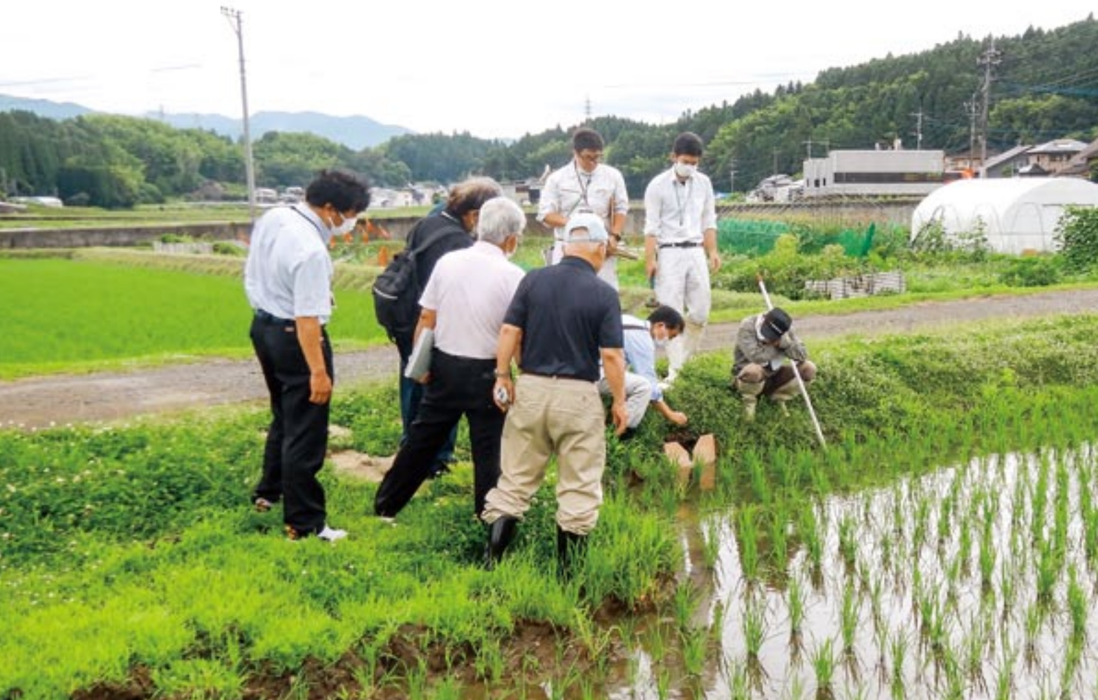
田んぼダム実証調査における耕区排水樹への堰板設置（日田市朝日地区）