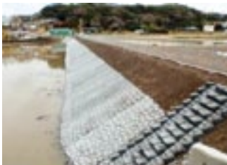
ため池護岸の整備