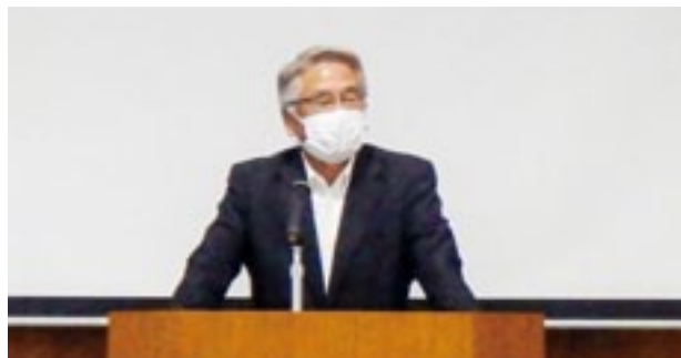
義経会長あいさつ

午後は、大分川河川敷にてレベルの使い方やスタッフ（箱尺）の読み方、基本的な簡易測量であるポール横断の講習を実施。レベルを用いた水準測量では、観測結果から標高を求める一連の作業を受講生自らが行った。また、横断測量ではポール方式に加えトランシットによる測量手順と、新技術である3Dスキャナを用いて点群データを観測・処理する方法の説明を行った。研修会後のアンケート結果からは「理解できた」といった回答が