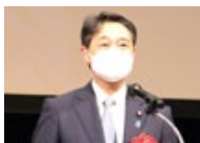
来賓挨拶 (進藤参議)