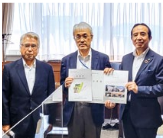
宮崎敏行九州農政局長へ要望