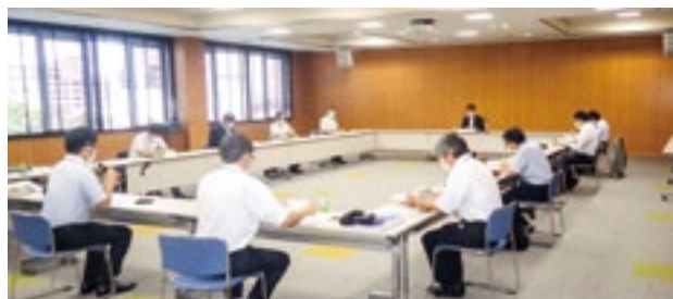
受益農地管理強化委員会

分常務理事）の挨拶の後、令和3年度事業報告並びに決算、令和4年度事業計画（案）並びに予算について審議され、いずれも承認された。委員会で協議された意見を今後の体制強化事業の運営に反映させていく。