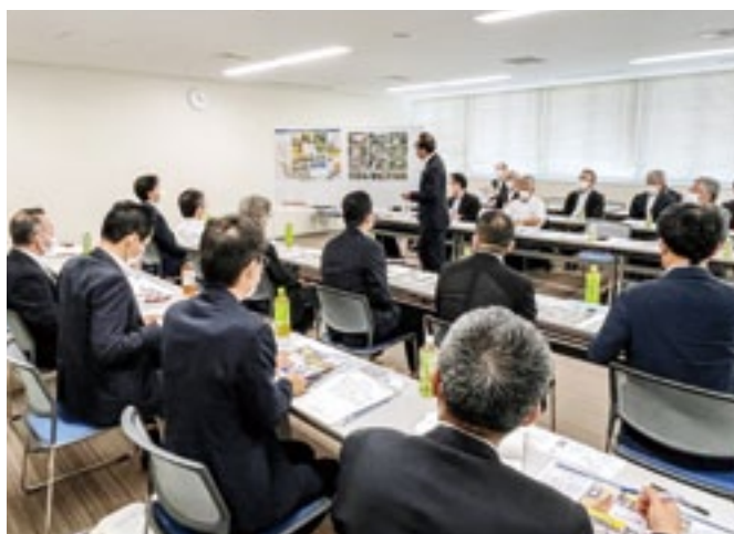
是永市長が農政局へ要望内容を説明