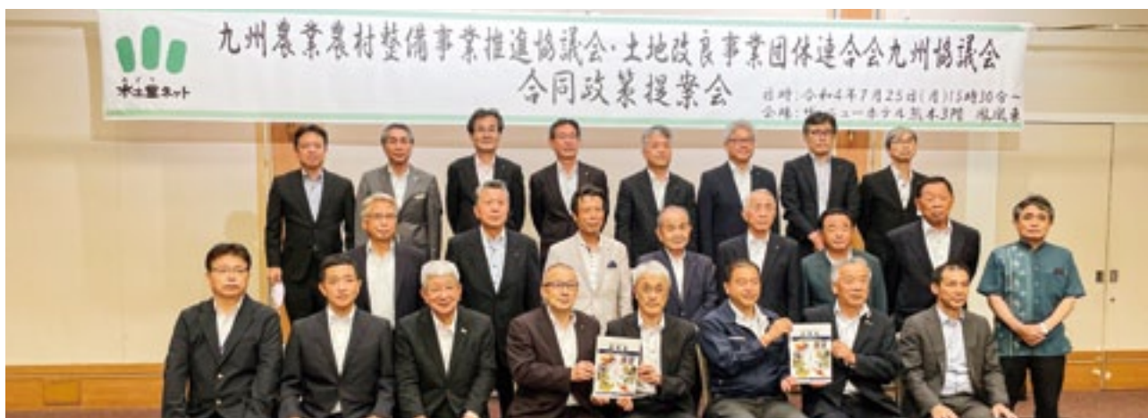
九州農政局への提案活動