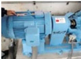
高効率型モーターへの更新