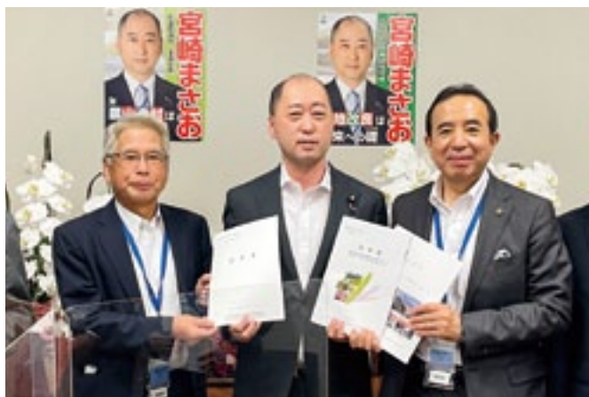
宮崎雅夫政務官へ要望