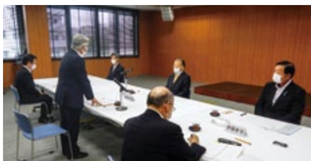
第1回監事会・監査

7月5日（火）、令和4年度第1回監事会・監査が開催された。監事会では、年間の実施計画として10月に中間監査と補正予算の審議、1月に最終補正予算と令和5年度当初予算の審議を行うこととした。続いて監査が実施され、令和3年度事業報告、決算について諸帳簿・証拠書類等の確認、令和4年度第1