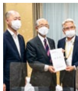
金子大臣(中央)、 宮崎政務官へ要請