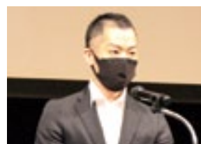
地域の声 (岩切主査)