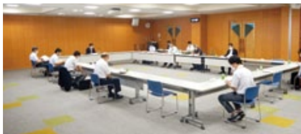
管理運営体制強化委員会