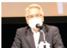
主催者挨拶 (義経会長)